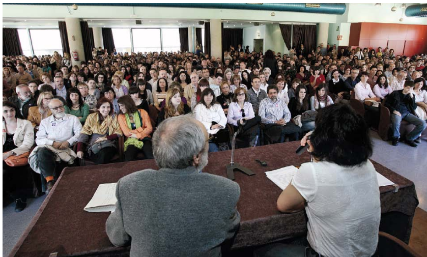
La benvinguda a les famílies es va fer en una sala de l'Hotel Serhs Campus.

Igual que en les edicions anteriors, la jornada es va iniciar en una sala de