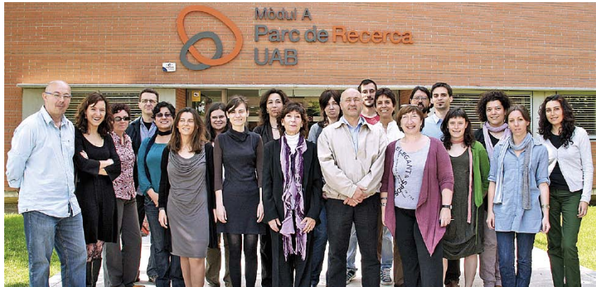
El CER-Migracions està ubicat a l'edifici MRA (Mòdul de Recerca Avançada) del campus nord de Bellaterra.

Ousmane Kote va morir el setembre del 2008 després de ser agredit presumptament per una persona d'ètnia gitana al barri Las 200 Viviendas de Roquetas de Mar, on conviuen persones de més de cent ètnies diferents.