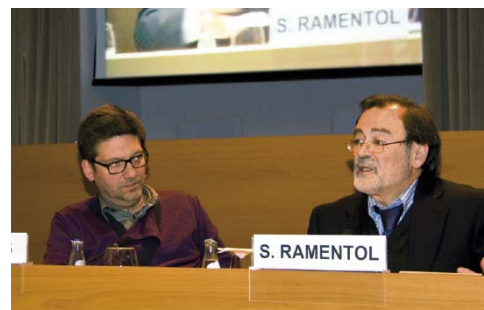
Diferents moments del debat.