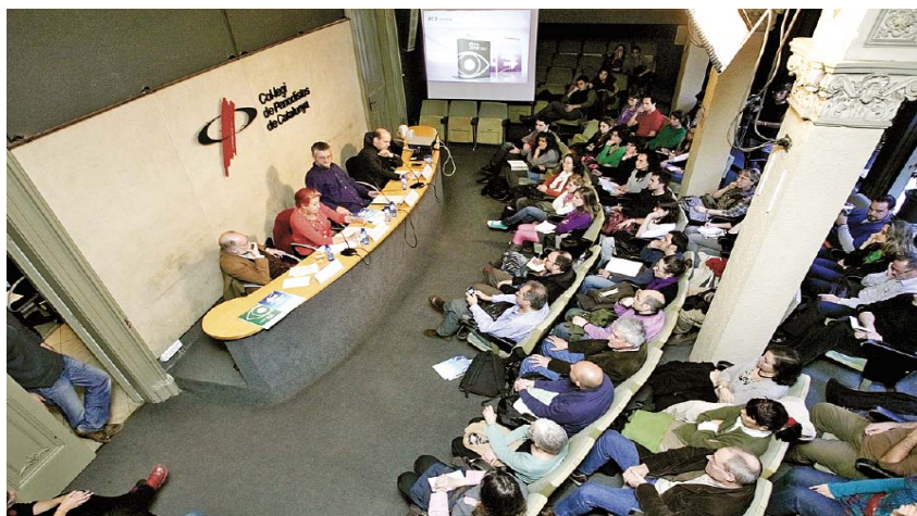
La presentació de l'informe anual de l'Escola de Cultura de Pau es va fer al Col·legi de Periodistes el 14 d'abril passat.

El Govern de la Generalitat ha aprovat el Pla de Recerca i Innovació (PRI) 2010-2013 amb una inversió de 5.308 milions d'euros, la xifra més alta mai aprovada a Catalunya en un pla destinat a la recerca. El document marca les polítiques públiques que han de portar cap a un nou model de l'economia catalana basat en l'educació, el coneixement i la innovació i que han de crear més ocupació i de millor qualitat. El nou Pla identifica disset focus estratègics de recerca que han de liderar aquest canvi de model, entre els quals destaquen els de l'eficiència energètica i les energies renovables; la gestió de l'aigua, la mobilitat sostenible i els edificis adaptats a les noves necessitats socials, la millora dels sistemes d'organització en el treball i els productes destinats al turisme i a l'oci. A més, el pla vol potenciar sectors que a Catalunya ja tenen una posició consolidada, com ara l'agroalimentari o la salut. Del total pressupostat, 2.209 milions corresponen a personal dedicat a la recerca en el sistema universitari i assistencial. L'increment anual de la despesa en R+D+I estarà entre el 15 el 20 %.