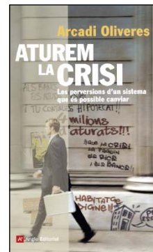
ATUREM LA CRISI. Arcadi Oliveres. Barcelona: Angle, 2010.

Actualment a la Universitat Autònoma de Barcelona, l'Àrea de Prevenció i Assistència coordina les funcions establertes per la llei.