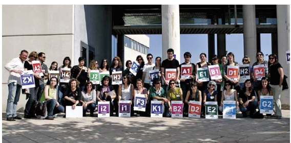
Les famílies es van distribuir en algun dels quaranta autobusos per fer un recorregut guiat pel campus. En l'organització de les jornades van participar unes vuitanta persones en total.