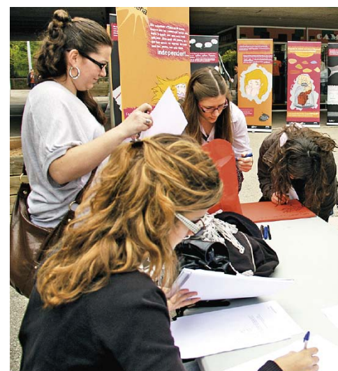
La FAS va muntar paradetes a la plaça Cívica.