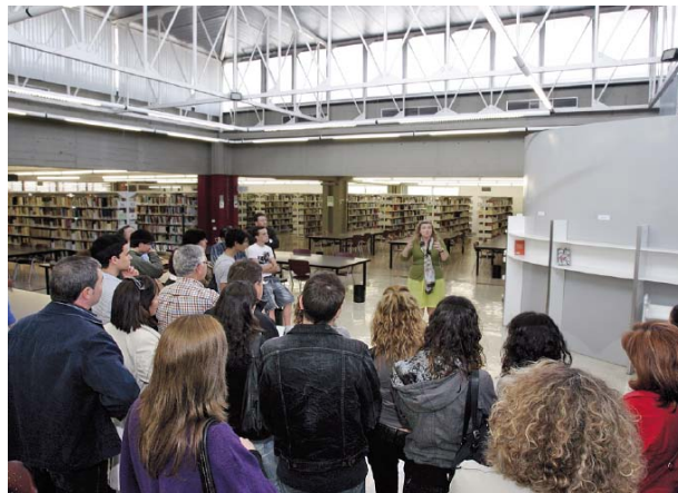
Dos moments de les visites a un dels laboratoris i a la biblioteca de les facultats de Ciències i de Biociències.