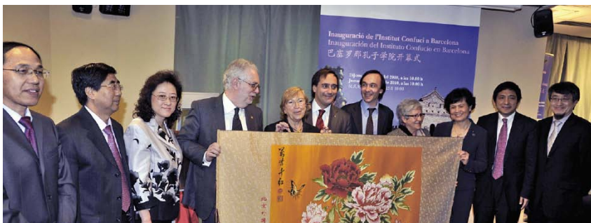
Fruit de l'acord entre diferents entitats, l'Institut vol difondre l'ensenyament de la cultura i la llengua xineses a Catalunya.

L'Institut Confuci de Barcelona és el quart que s'inaugura a Espanya després dels centres que hi ha a Madrid, Granada i València, i desenvoluparà activitats acadèmiques i culturals a Casa Àsia, la