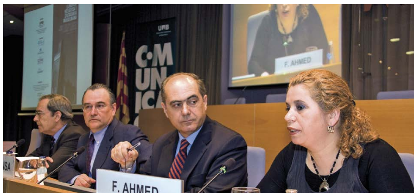
La signatura de l'acord es va fer coincidint amb les jornades «Llibertat religiosa i ciutadania musulmana».

La UAB va signar, el 9 d'abril, un conveni amb el Consell de la Comunitat Marroquina a l'Estranger (CCME). Entre els objectius d'aquest acord destaquen la creació d'una càtedra d'estudi sobre les relacions entre l'islam i Catalunya, l'edició d'estudis sobre la comunitat marroquina i l'intercanvi d'estudiants i de personal docent i investigador.